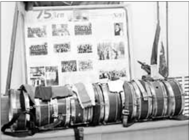
■ Один из разделов экспозиции посвящен истории пионерии и комсомола