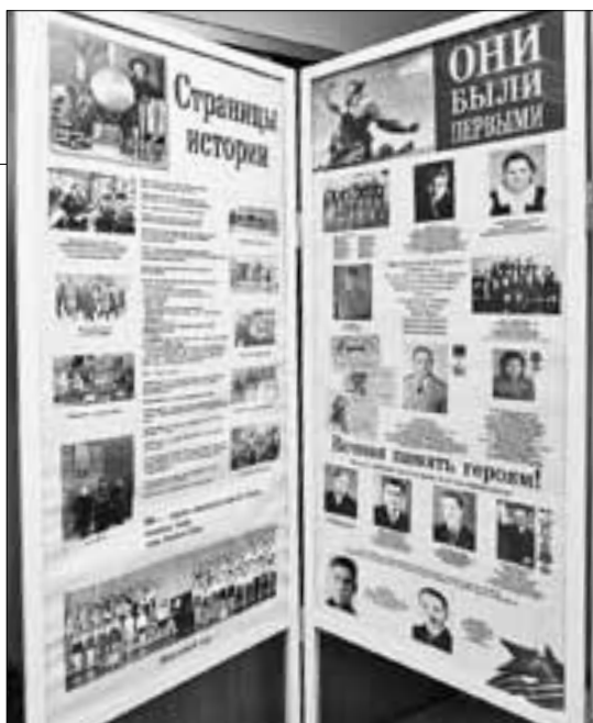
■ Современные музейные стенды – страницы истории школы и поселка 3-го лесозавода