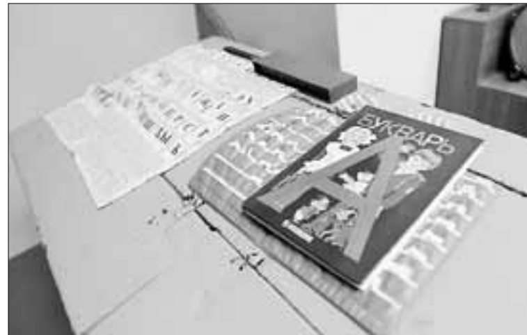
■ Школьники могут посидеть за партой советского образца, окунуться в обстановку прошлых лет